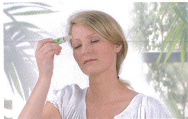
Ätherische Öle – hilfreich bei vielen Gelegenheiten

Seit mehr als 20 Jahren bietet TAOASIS ein Sortiment von über 150 verschiedenen, natürlichen Düften, eine breite Auswahl an innovativen Raumbefudungsgeräten und Bioparfums an, produziert heute zudem für renommierte Unternehmen und liefert die kostbaren Düfte in über 20 Länder der Welt.